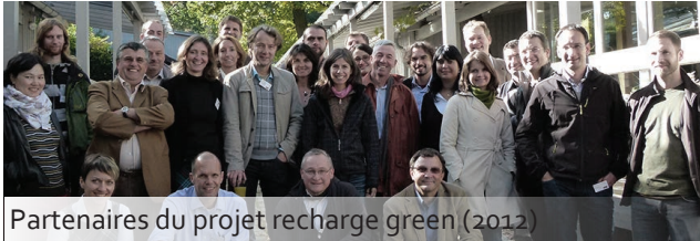
Partenaires du projet recharge green (2012)