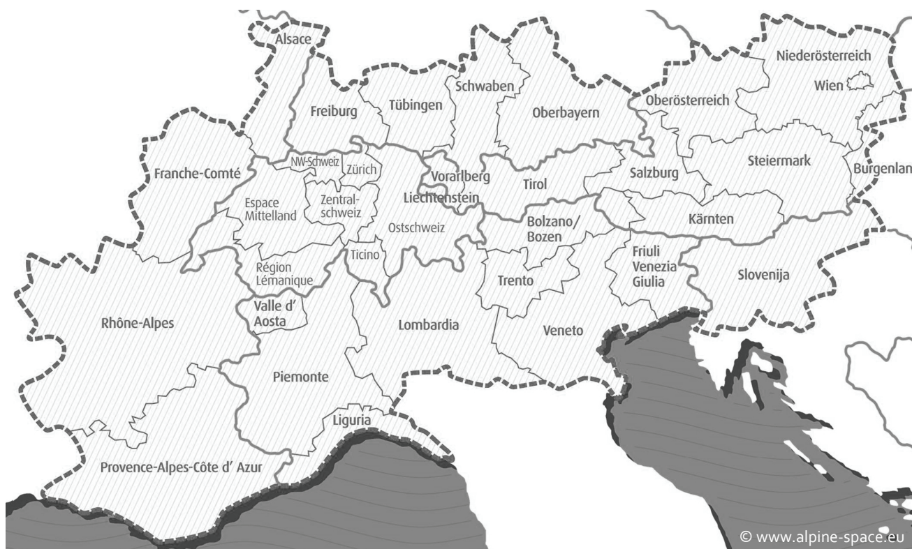
Zone de coopération du programme Espace alpin.

Projets avec participation suisse 2007 – 2013