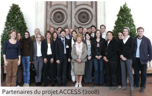
Partenaires du projet ACCESS (2008)