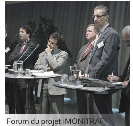
Forum du projet iMONITRAF!