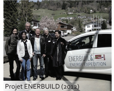
Projet ENERBUILD (2012)