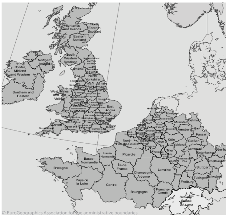
Zone de coopération du programme Europe du Nord-Ouest

Projets avec participation suisse 2007 – 2013