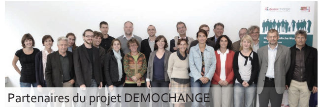
Partenaires du projet DEMOCHANGE