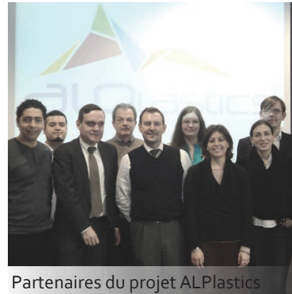
Partenaires du projet ALPlastics