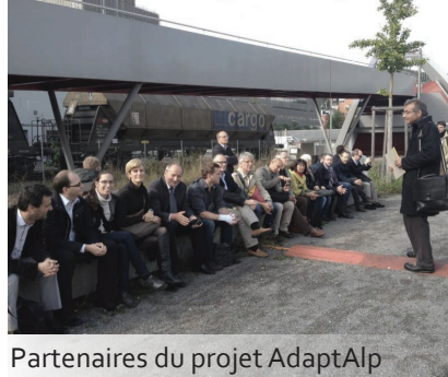
Partenaires du projet AdaptAlp