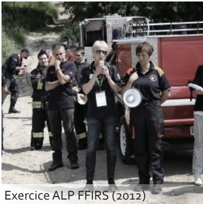
Exercice ALP FFIRS (2012)