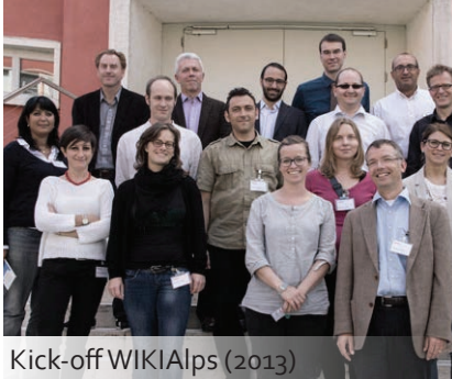
Kick-off WIKIAlps (2013)