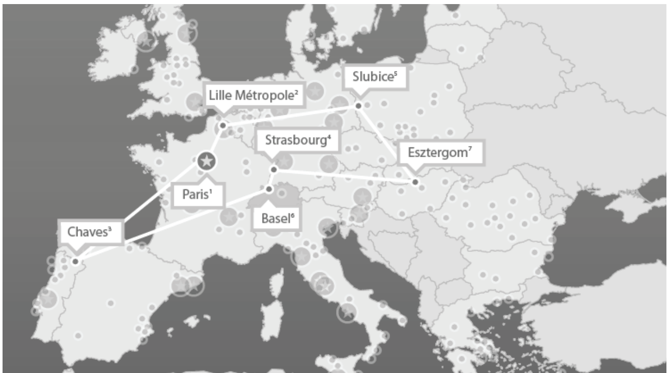
Réseau de villes du projet URBACT „EGTC“

Projects avec participation suisse 2007 – 2013