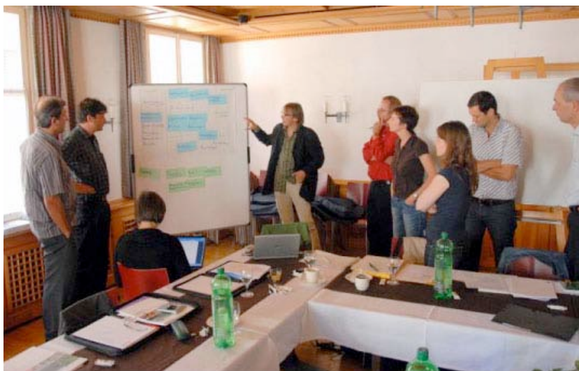
Membres de la CoSF «Rôle, fonction et tâches des régions et des managers régionaux de la NPR» pendant la recherche de thèmes.

Lichtensteig (SG)