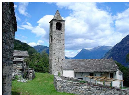
Im Bild: Monte di Pai mit der Kirche San Martino. Der Bergweiler oberhalb von Lodrino war früher ganzjährig bewohnt.

Die Eröffnung des Gotthardtunnels von 1882 erlaubte, mit der Eisenbahn erstmals ganzjährig Menschen und Güter in nahezu unbeschränkter Zahl in und durch das Tessin zu transportieren. Das löste den ersten Tourismusboom aus. Später brachte die Autobahn eine weitere Beschleunigung auf dem Weg zwischen Nord und Süd