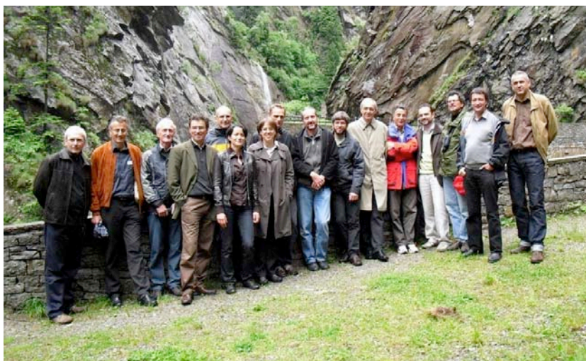
Teilnehmende der Wissensgemeinschaft «Koordination NRP-Sektoralpolitiken – Landwirtschaft, Tourismus und Lebensraum» am 9. Juni 2009 in der Piottino-Schlucht, Rodi-Fiesso (TI).

Die Piottino-Schlucht – während langer Zeit ein Verkehrshindernis für den Nord-Süd-Verkehr, Foto K. Conradin